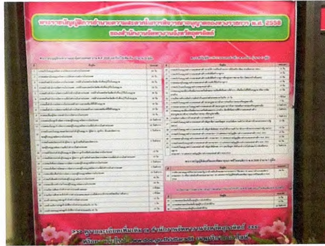
ภาพถ่ายการติดตั้งแผนผังการให้บริการ